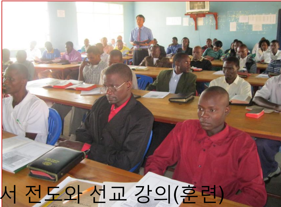
TAG Bible College 에서 전도와 선교 강의(훈련)