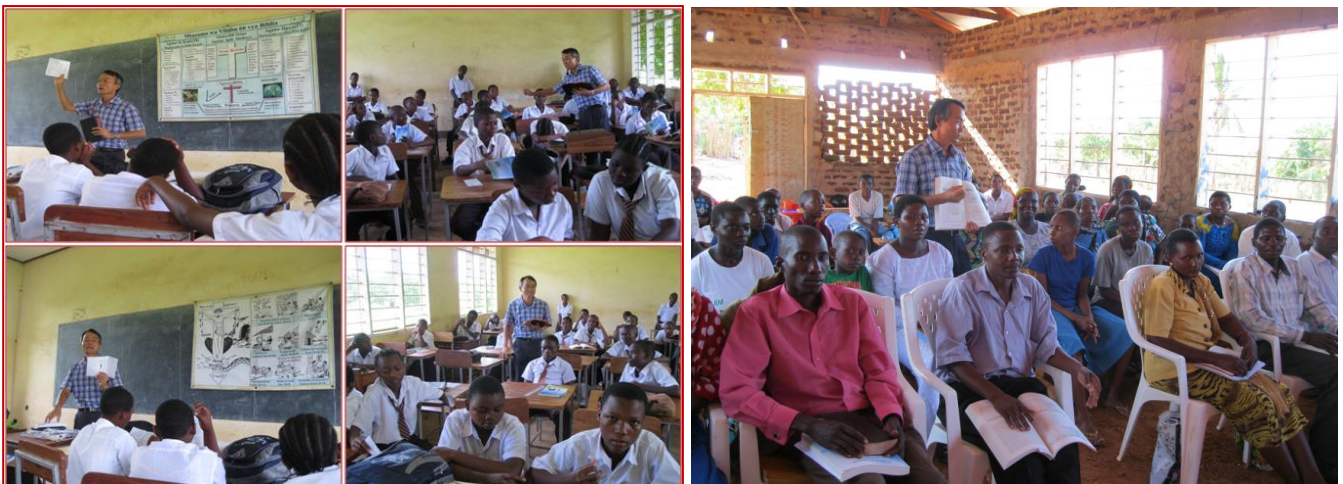
추노(Chuo secondary School)

탄자니아는 초등학교가 7 년, 중학교가 4 년, 고등학교가 2 년입니다. 공립 초등학교(40 분), 중, 고등 학교(60 분)는 매주마다 한번씩 종교 시간이 있습니다. 무슬림 학생들은 코란을 배우고, 기독교 학생들은 성경을 배우고 있습니다. 학교 안에서도 무슬림 비율이 높기 때문에 90 % 이상이 코란을 배우고 있습니다.