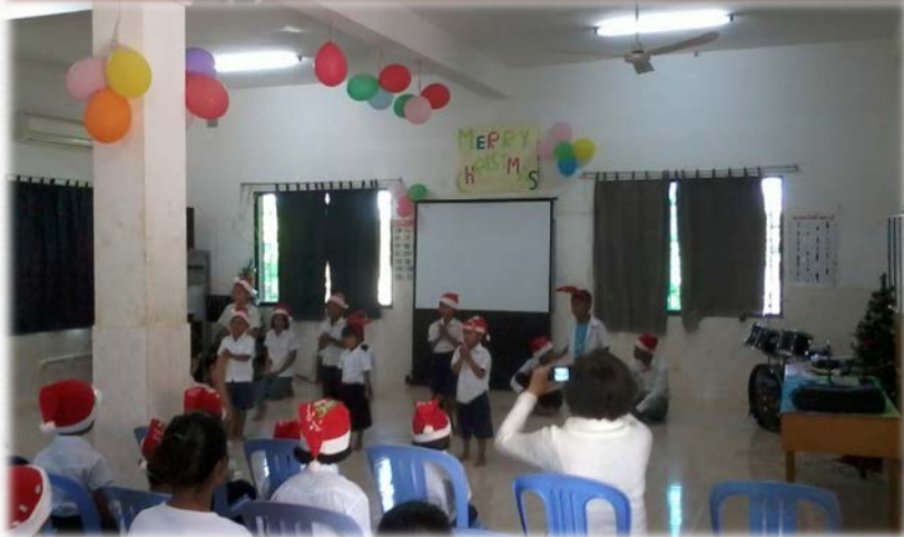
성탄발표 준비연습과 축하발표