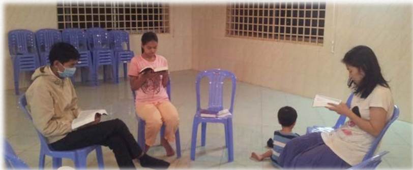
새벽기도 & Q.T. 나눔의 시간