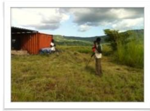
보마 컴파운드 주변 잡초 제거

남수단은 현재 수도 이전 계획이 진행 중입니다. 정부는 현재 수도인 Juba 에서 Ramciel 로 이동할 계획을 세우고 있습니다. Ramciel 의 의미는 '중앙에서 만나다.'라는 의미로 수도가 이전되면 Ramciel 에서 다른 지역으로의 이동이 더 편리해 질 것으로 예상됩니다.