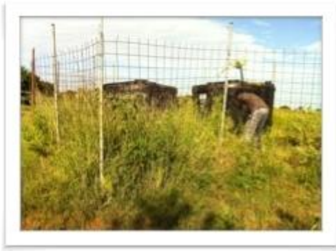
이티마을 물탱크 주변 잡초 제거