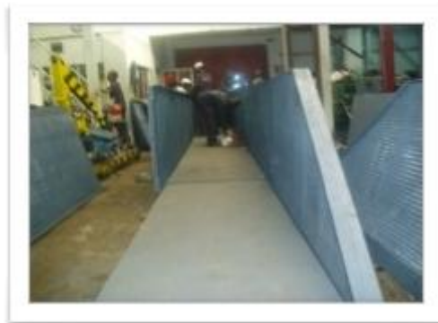
나이로비에서 작업 중인 Love Bridge 교량 block

팀앤티 남수단은 길었던 우기를 마치고 다시 사역 진행을 위해 분주하게 움직이고 있습니다. 12 월에 진행될 2 차 Love Bridge 교량 건설 사역을 위해 현재 나이로비에서 건설에 필요한 Block 작업이 계속해서 진행중에 있습니다. 지난 해 시작된 Love Bridge 교량건축은 남수단 독립 투표, 보마 지역에서 발생한 부족 간 총격전 등으로 인한 치안의 불안정과 컨테이너 전복 등으로 지연 중이었습니다. 12 월 교량건축이 진행되어 보마의 두 부족을 연결하는 다리가 완성되면 부족간 다양한 교류 증진으로 인한 평화가 올 것으로 기대됩니다. 또한 기초 인프라에 대한 접근이 향상되어 기본적인 생활이 가능해 질 것입니다.