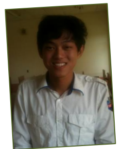
2015년 8월 15일 강의실에 혼자 있던 형