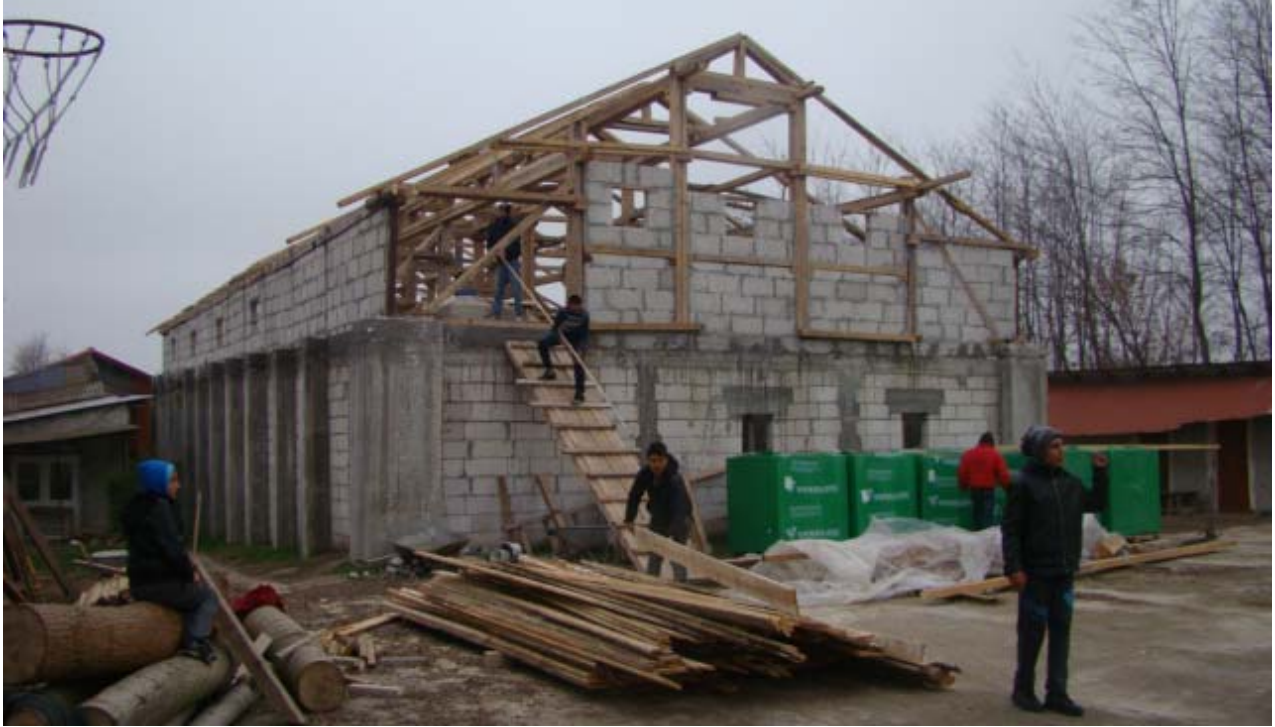
5년째 공사중인 지도자 영성훈련원/ 천소년 문화센터

눈이 오기전에 지붕을 씌울수 있을까 걱정하면서 2015년을 마무리 하게 되네요. “아부지 지붕씩우고 겨울을 나아하는데 일기예보상으로는 눈을 내리실거라고 하셨는데 한주간만 더 버티어 주시면 안될까요” 라고 때를 써가며 눈물로 아버지앞에 나아가 무릎을 연하며 공사에 임했습니다. 2층 숙소 건축 때문에 지붕 높이가 9미터 반이나 되니 바람 쌩쌩불고 날씨가 춥고 공사하기가 여간 힘이 듭니다. 하루 올라가서 일하고 저녁에는 그냥 뺏어 버렸습니다. 설상가상으로 감기까지 겹쳐서 기침이 심하니 주일날 설교하는데 애를 먹었습니다. “아부지! 힘들어서 더는 못하겠어요. 손에 힘이 없어서 못을 못잡겠어요. 아버지 보내주실 사람 없어요?” 현지인 친구인 율리안 목사에게 일꾼들 데리고와서 지붕공사좀 마쳐달라고 했더니 점심때가 다되어 6명을 끌고와서 달라붙었습니다. 할렐루야! 아버지가 일사천리로 일처리를 오랫동안에 빨리빨리 처리해 주시니 눈물로 감사를 드립니다. 둘째날은 다섯째 아들 아디 아버지와 삼촌도 불러서 담배값이라도 벌도록 지붕공사에 초청하여 함께하도록 했습니다. 셋째날은 보슬비가 오기시작해서 작업에 여간 어려움이 있었습니다. 하더라도 일꾼들은 열심히 합판을 대고 못질을 했습니다. 하루 빨리 지붕공사를 마치고 겨울잠 자는 동안에는 두 다리 쪽 뺏고 말씀과 기도에만 올인했으면 하는 간절한 바램입니다.