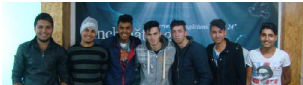
믿음안에 양자 삼은 든든한 아들들입니다. 왼쪽부터 소개하자면