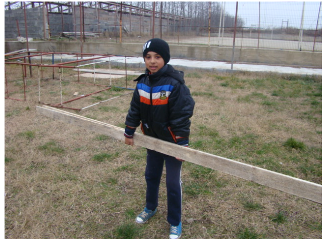
예배 후에 고사리 같은 손으로 건축공사에 일목을 했습니다.

개구장이 미하이도 시기질투의 대명사 안드레아도 예배시간마다 장난을 치고 소란을 피우는 방해꾼 마테이도 열심히 거들었습니다. 예수님을 개인의 구주로 영접을 하고 삶의 목적을 발견할때 쯤이면 어느덧 어른이 되어서 면소재지의 주인공들이 되어 있을 것을 묵상해봅니다. 어린주일학교를 거쳐서 천소년기를 갯세마네 지빛교회공동체에서 지내오는 동안 복음의 씨앗이 저들의 삶속 깊숙히 심겨져서 방황을 하고 혼동으로 하고 의심을 하고 흔들린다고 할지라도 다시 복음안으로 돌아와 십자가 복음안에서 삶이 정착되기를 소망해 봅니다.