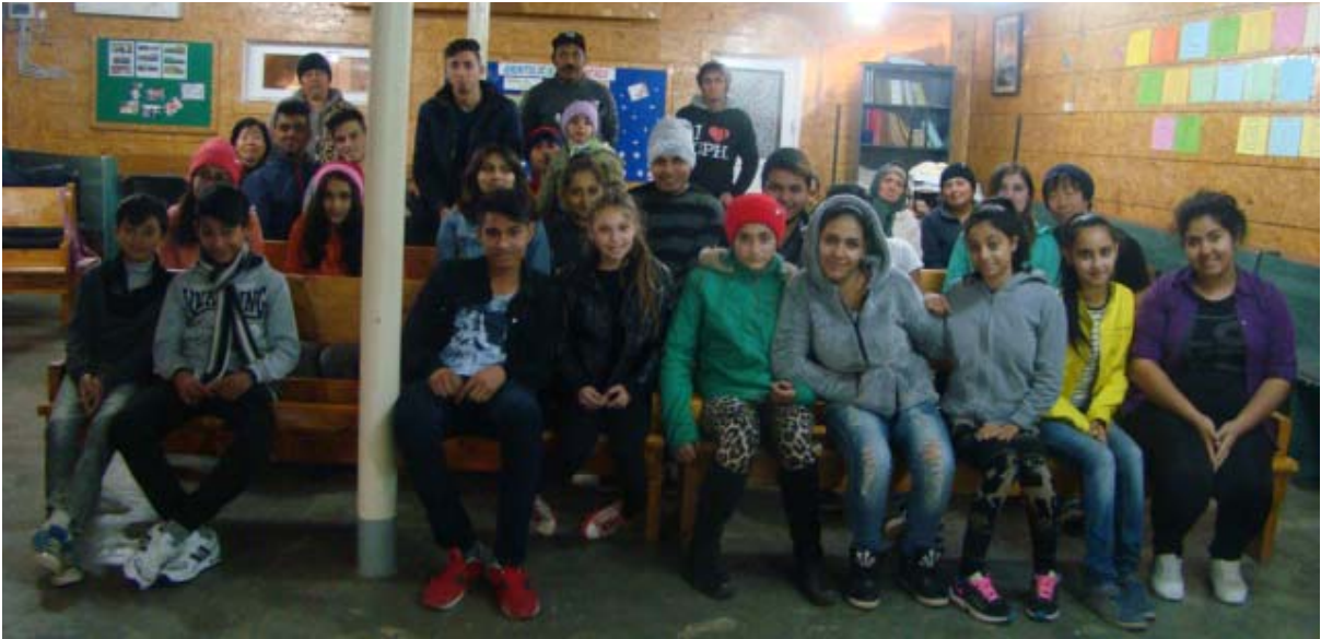
51일째 주일 예배후 성도들과 함께

5-8학년 사춘기 집시 청소년들이 지금 한창 위험한 때이고 신경이 곤두서는 때이고 행여나 12-13세 조기결혼 악습에 대물림할까봐 노심초사 기도를 쉴수가 없게 하십니다. 올해는 2명의 딸들과 셋째 아들 싸미를 잃은 해였습니다. 내년에는 또 몇명의 아들 딸들을 잃게 될런지..... 또 몇명의 아들 딸들을 양자로 삼아주실지 설래임과 기대 속에서 “아버지, 사랑하는 아들딸들을 믿음안에 꼭 지켜주세요” 무릎으로 더 가까이 나아가게 됩니다. 집시들이 잘하는 것 하나가 있는데 그것은 아무때고 “아멘” 하기 때문에 속기 쉽고 지치기 쉽고 낙심되기 쉽지만 이제는 저들의 수법을 안이상 영적 전투에서 결코 패하지 않을 자신이 생겨서 눈물로 감사를 드립니다. 어느듯 핸드폰 문화가 저들 청소년들 생각속에도 깊숙이 파고 들어서 자리를 잡아가고 있습니다. 믿음안에서 잘 성장하기를 소망하며 무릎을 연할때면 또 다시 아버지가 힘주시니 능히 감당할수 있어서 감사합니다.