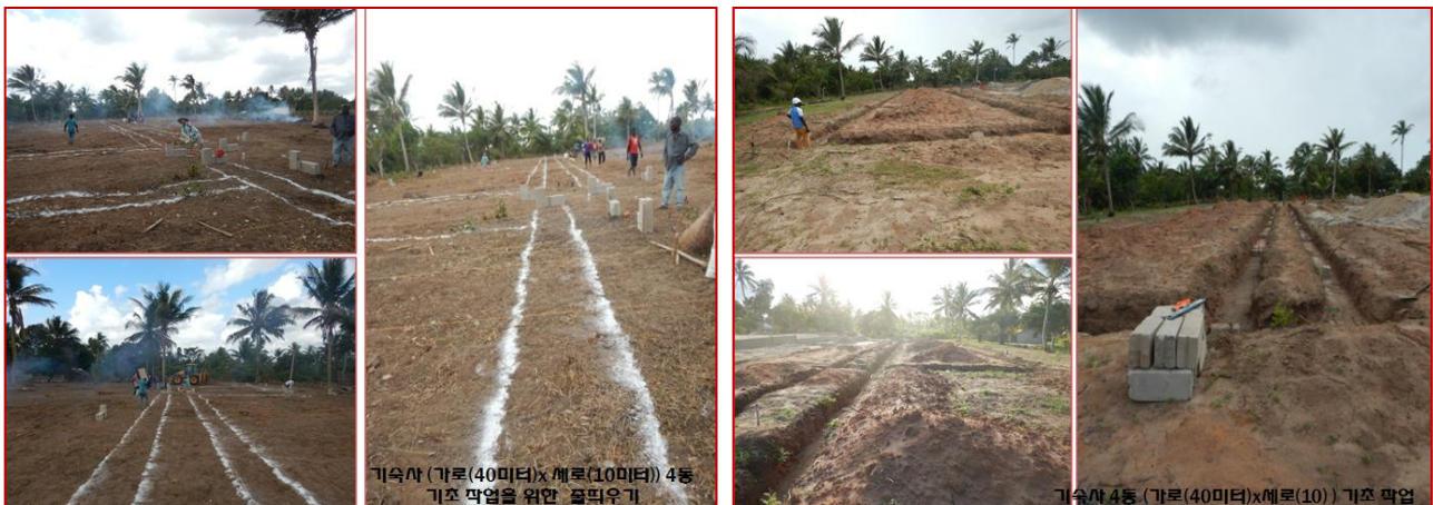
기숙사 (가로(40미터)x 세로(10미터)) 4동 기초 막업을 위한 흙피우기